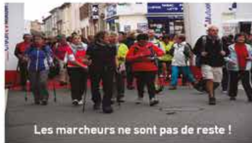
Les marcheurs ne sont pas de reste !

Mairie de Lavit, Jean-Michel Baiotto, Carrefour Express, Communauté de Communes, et Office de tourisme de la Lomagne Tarn et Garonnaise, le Crédit Agricole Nord Midi-Pyrénées, Jérôme Sébille, le Vic de Lomagne, Louda Val Fleuri, Vincent Durrens, Alinéa Top Alliance, Le Terroir Lomagnol, la Cave de Saint-Sardos, Pharmacie Delon-Godard, Peugeot Lavit Delzers-Marti, HGT Morzine, Publi-Services, Michel Coureau, Le Petit Journal, La Dépêche.