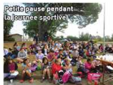
Petite pause pendant la journée sportive