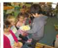
Dégustation de pommes