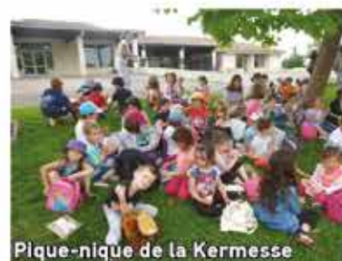
Pique-nique de la Kermesse