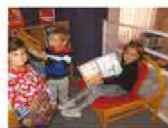
Sortie à la bibliothèque municipale

Merci à la municipalité qui nous soutient au quotidien dans tous nos projets.