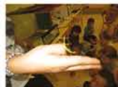
Elevage de Phasmes