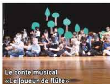
Le conte musical «Le Joueur de flûte»