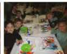
Petit-déjeuner à l'école