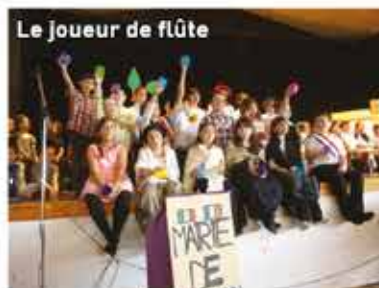
Le Joueur de flûte