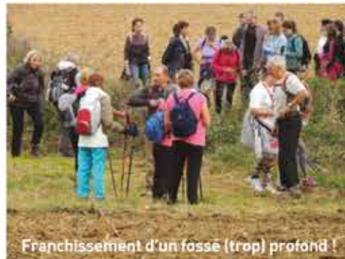
Franchissement d'un fossé (trop) profond !