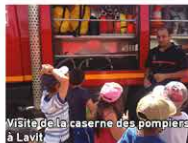
Visite de la caserne des pompiers à Lavit

Nous remercions la municipalité, qui nous suit dans tous nos projets.