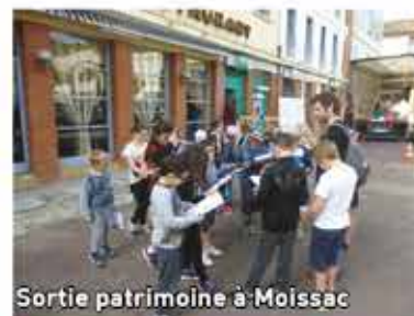
Sortie patrimoine à Moissac