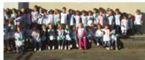
Nettoyons la nature, tri et recyclage des déchets