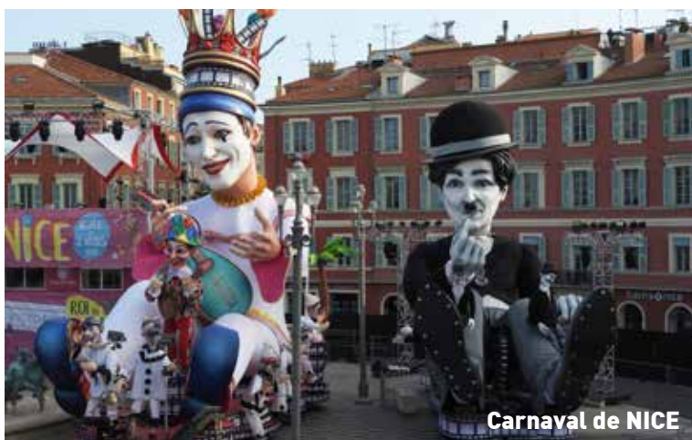
Carnaval de NICE