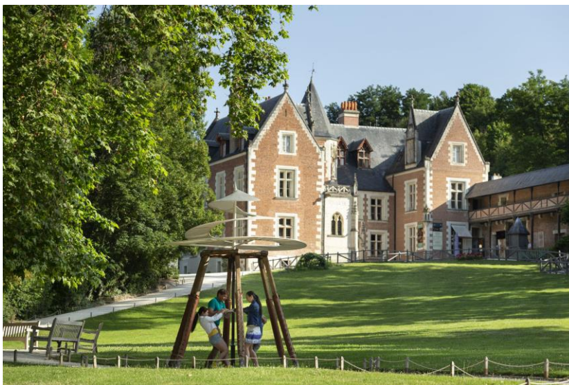
Château du Clos Lucé

REGLEMENT : A l'inscription : 2 chèques de 250,00 € par personne.